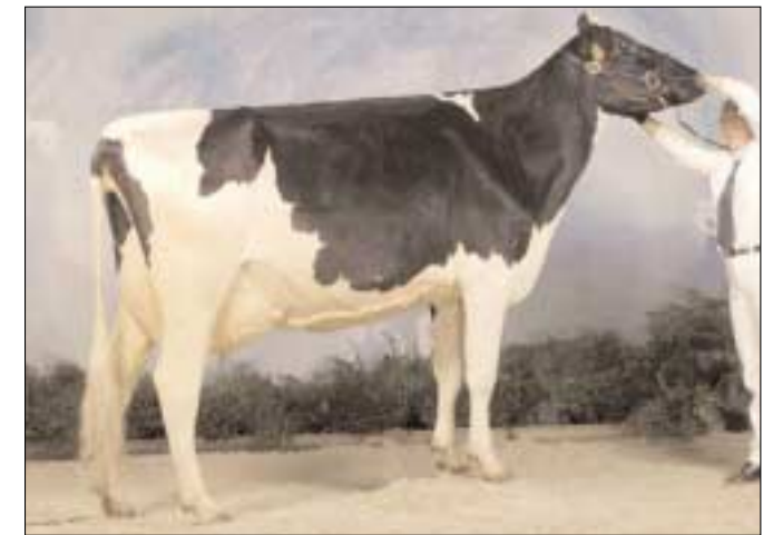
Melissa du Kasteel Binst (v. Storm), res. kampioene jonge koeien productie eerste lijst: 305 7982 4,61 3,34