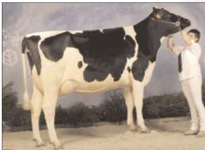
Jachette de l'Herbagère (v. Jocko Besne), res. kampioene vaarzen Productie: 37 1318 3,76 2,89 i.i.