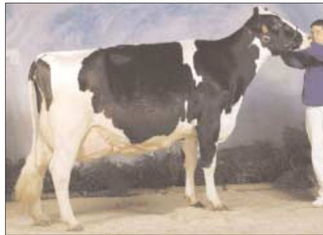
Godena (v. Jolt), reservetitel kampioene oude koeien Productie tweede lijst: 305 11.104 3,72 3,18