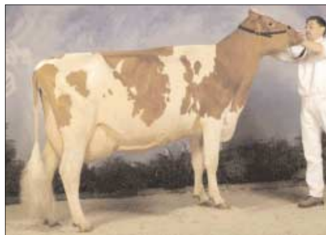
Suzan (v. Stadel), kampioene middenklasse Productie: 2.00 305 8641 4,69 3,50

Algemeen kampioenschap voor Vlaamse Tulipdochter Reina