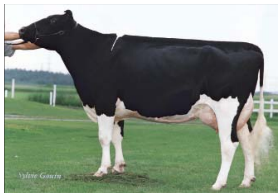
Granduc Jewel Astre (v. Astre), 85 punten, moeder van actuele koe-indextoppers Productie: 4,00 305 18.299 4,0 3,2