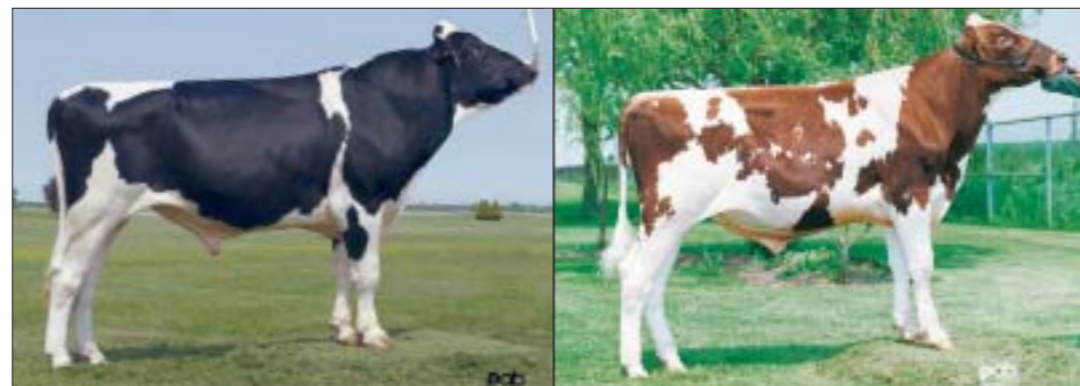
Granduc Tribute, één van de eerste grote namen onder de Cherrynazaten

melk met 3,50 % vet en 3,10 % eiwit na 305 dagen, beloond met een hoge notering in de Canadese indexenlijst op basis van IPV. Dat alles in combinatie met haar fraaie exterieur, goed voor een beoordeling met 85 punten, maakte de Skylerdochter interessant voor ET. 'Bij alle familieleden uit de Cherryfamilie hanteerden we steeds hetzelfde principe', vertelt Leduc. 'Cherry en haar nakomelingen zijn voor het grootste deel pas na twee lactaties ingezet in een speelprogramma. Veel mensen baseren zich in de fokkerij op enkel de eerste lijst.