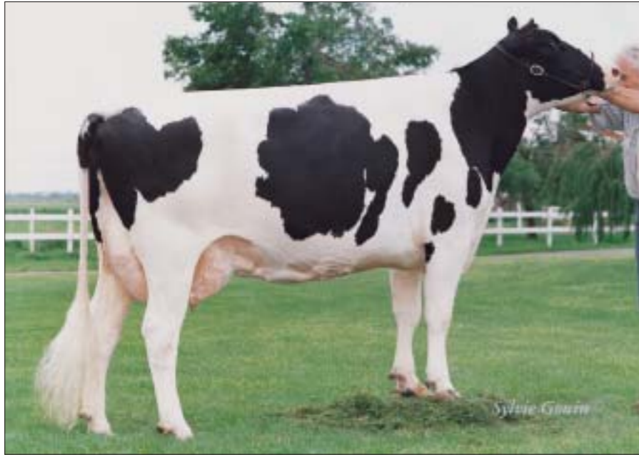
Granduc Marla Astre (v. Astre), 85 punten. Productie: 4,01 305 17.038 4,3 3,6