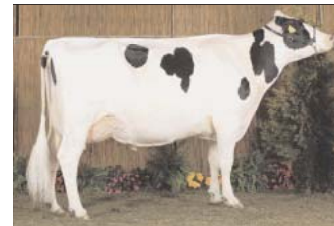
Aaltje 49 (v. Starleader), kampioene vaarzen Productie: 2,09 185 9041 4,31 3,21 LW 142 I.I.