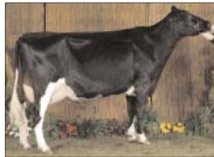
Mia 124 (v. Juror), reserve senioren Prod.: 3,10 483 12.741 5,04 3,72 LW 107