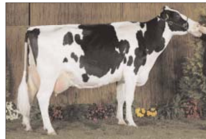
Aaltje 46 (v. Jolt), kampioene senioren Productie: 4,02 322 13.416 4,07 3,44 LW 123