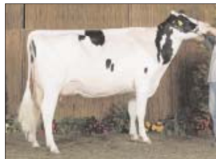
Dikkie 132 (v. Red Marker), res. vaarzen Prod.: 2,09 81 3464 3,96 3,25 LW 118 I.I.