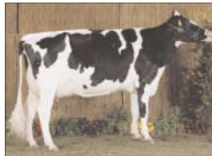
Super Star 24 (v. Big Macho), res. midden Prod.: 2,02 677 18.335 4,77 3,73 LW 115