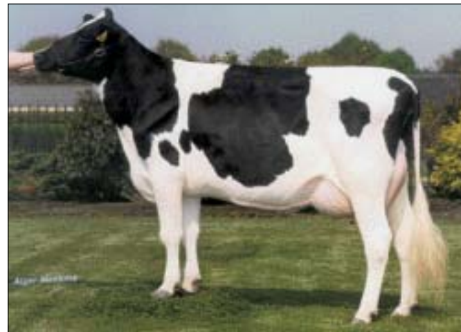
Grashoek Ruth 42 combineert exterieur met productie