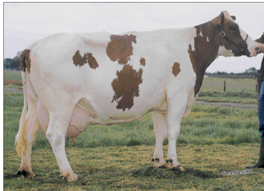
Marian 123 (v. Cowboy), één van de vijf verschillende Mariannen die in de topvijf van het productieklassement stond

zoals uien en wortelen. Die laatste liters zijn leuk, maar ook erg duur.'