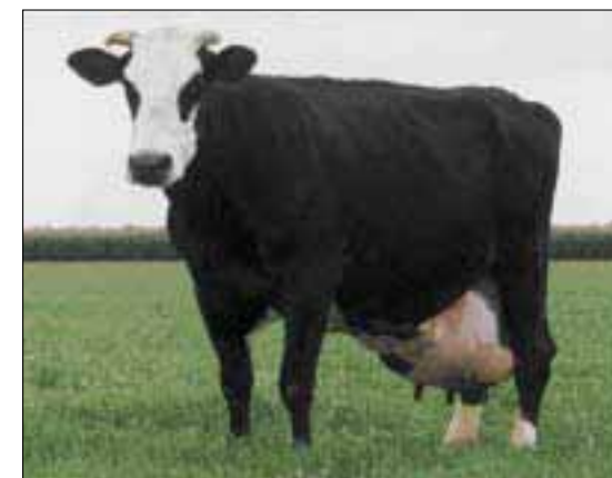
Sannie 3 (v. Superstar) stond vijf keer in de topvijf van het productieklassement

Koefamilies vallen op in het historisch productie-overzicht