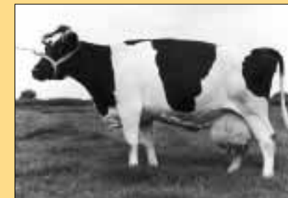
Pietje 131 (v. Adema 312 van de Woudhoeve), 89 punten Productie: 7,11 9169 4,37 3,32

Wat is de link tussen Almere Pericles en Woudhoeve Russel? Op het eerste gezicht hebben de zwartbonte gehaltestier en de roodbonte melkplasma-vererfer weinig gemeen, maar schijn kan bedriegen: de gezamenlijke stammoeder van Pericles en Russel heet Pietje 131, geboren in 1965 op het bedrijf van de familie Ruyter in Oosterblokker. Deze dochter van de stier Adema 312 van de Woudhoeve was een bijzondere koe. Niet alleen produceerde ze op 10 kg na 100.000 kg melk, ze verdiende ook een heel regiment aan onderscheidingen voor haar fokkerijprestaties. Haar drie zonen Woudhoeve 441, 478 en 495 kregen tal van nakomelingen, terwijl haar dochters Pietje 145 en 146 — een tweeling van Blitsaerd Setske's Keimpe — beide het predikaat preferent stammoeder in ontvangst namen. Bovendien toonden de twee zich bovengemiddeld duurzaam: Pietje 145 maakte elf lijsten en Pietje 146 tien. De tweeling staat ook aan de basis van de stambomen van Pericles en Russel. Uit de lijn van Pietje 145 kwam Woudhoeve Russel, uit die van Pietje 146 volgde Pericles.