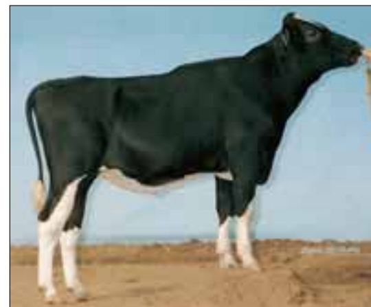
Grandprix volgt Cello op