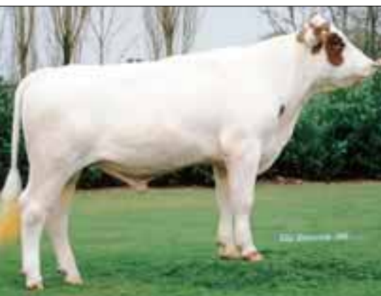
Marietje's Manuel lost Doris 249 af