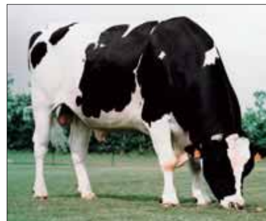
Jocko nipt verslagen door Design

Montbéliarderas een voorsprong op Jersey en Brown Swiss. De Montbéliardestieren noteren bijna 6500 eerste inseminaties, tweeduizend meer dan de geregistreerde aantallen van Jersey en Brown Swiss.