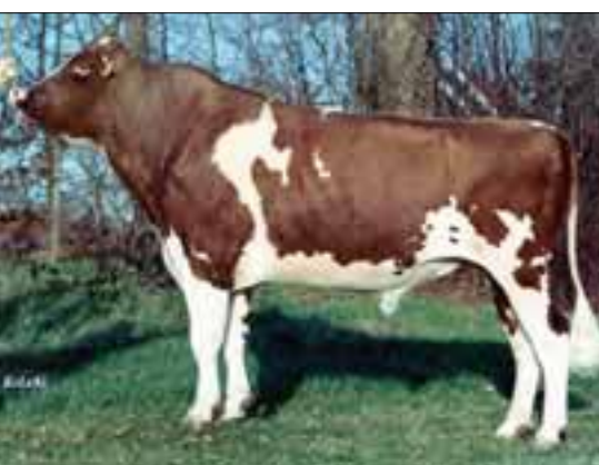
Faber klasse apart bij roodbont import