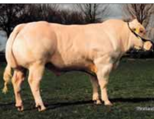
Heracles wint opnieuw