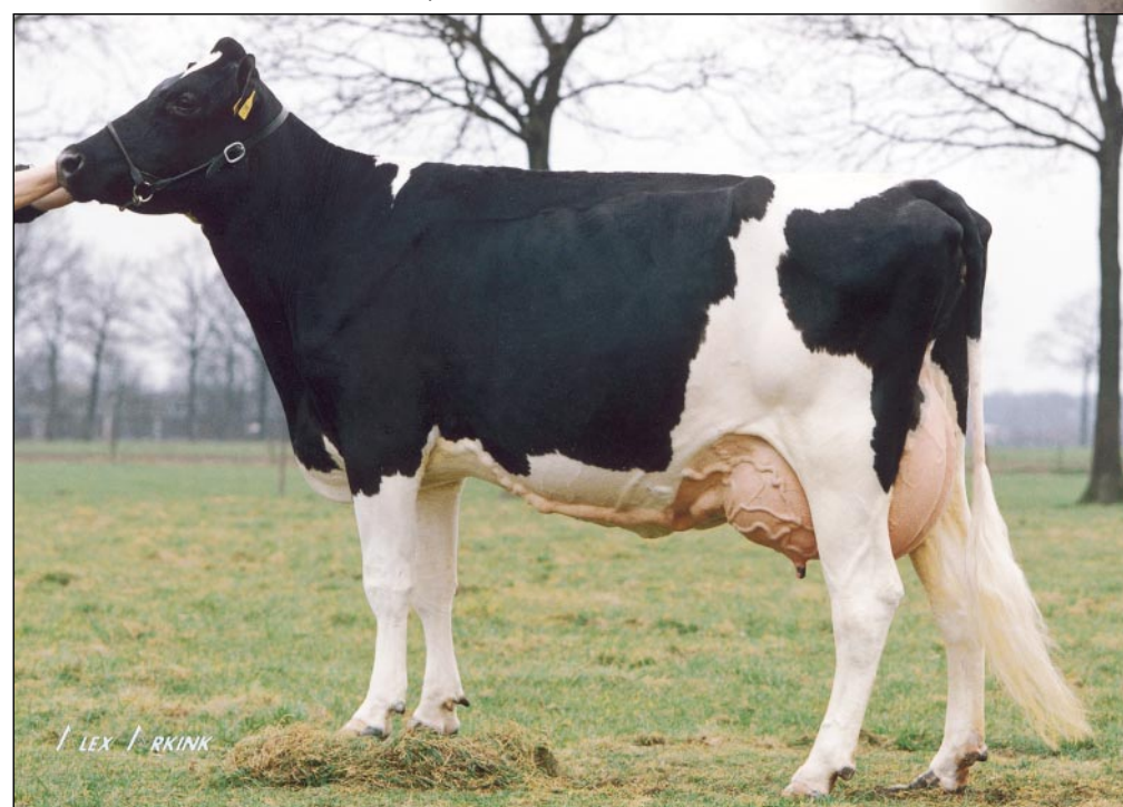
Southland Diëna 63 (v. Bell Rex), 87 punten. Prod.: 1,11 305 10.039 4,72 3,47 LW 145

In Italië Southland Vitus, in Nederland De Crob Dynasty CV. Dit voorjaar braken de twee halfbroers bijna tegelijkertijd hoog door in de indexlijsten. Vitus, zoon van de Italiaanse vererver Cesar Mascot Valentein, neemt in Italië de derde plaats in en scoort omgerekend € 191 DPS en 114 exterieur. Broer Dynasty (v. Lucky Leo) doet niet voor hem onder en staat met zijn € 313 DPS en 111 exterieur in de Nederlandse toptien.