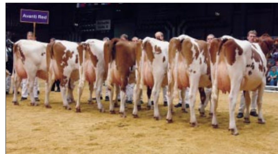
Avanti's lijken uit te kunnen groeien tot zware koeien

prima kruisen toonden. Ook de uiers zagen er goed verzorgd uit met een keurige uierbalans en scherpe ophangband. Het beenwerk rustte op sterke klauwen. Enig puntje van kritiek gold de spronggewrichten die even vol aandeden. Vanwege de grote vraag is de spermavoorraad van de Lukaszoon beperkt en daar zal na dit optreden geen verandering in komen. Bonatuszoon Blauer toonde vijf volwassen tweedekalfsdochters. Bijzonder groot oogden de Blauertelgen niet, maar ze toonden wel veel ribdiepte. De uiers hoefden voor tweedekalfskoeien niet meer volume te hebben.