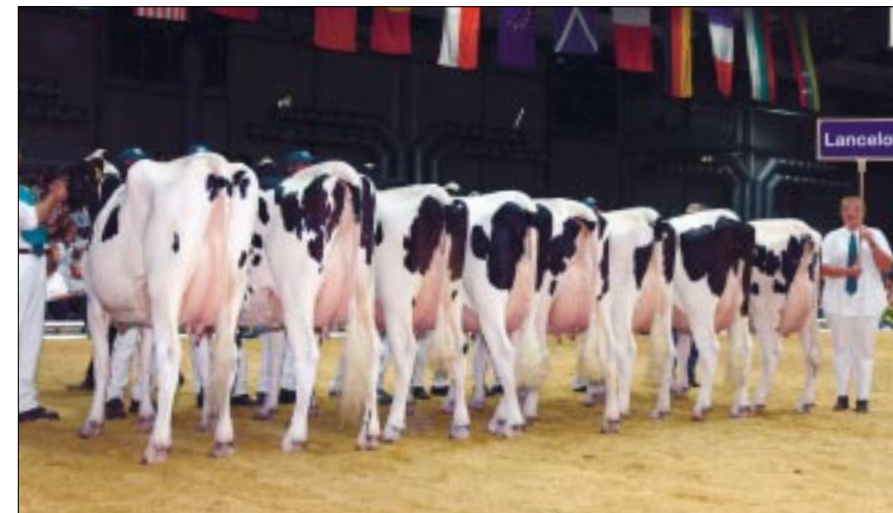
Lancelot toonde een uniform achttal goed geuierde vaarzen