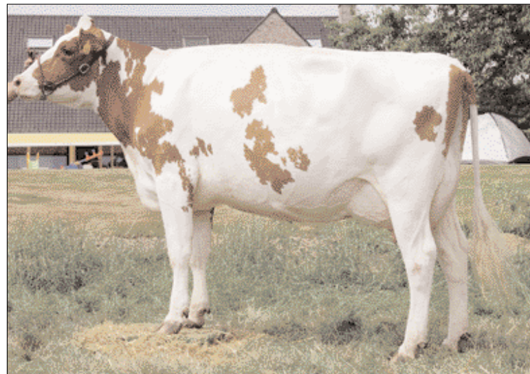
Shauri (v. Reynold Jano), kampioene roodbont jong Prod. : 3.02 256 6682 4,24 3,57 1.1.