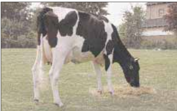
Sofia 34 (v. Banner), kampioene oude koeien Productie: 2,02 433 9650 4,22 3,61 LW 97