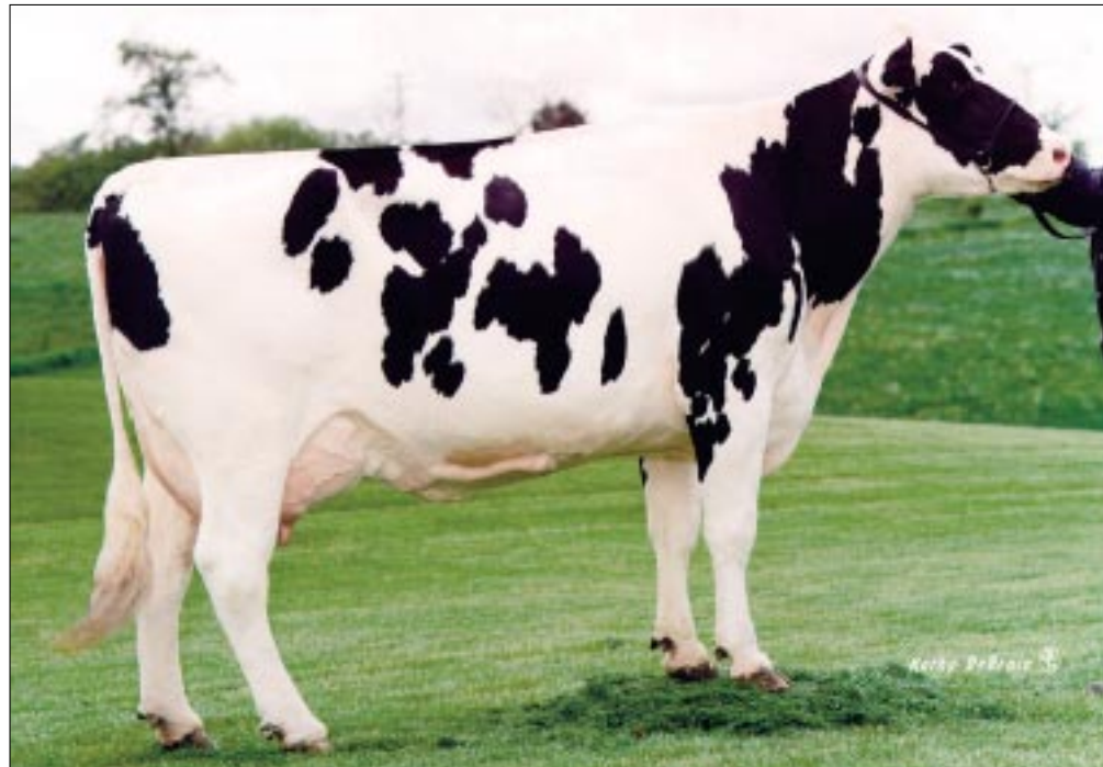
Meier-Meadows El Jezebel (v. Elton), 92 punten Productie: 4,02 305 13.971 4,5 3,5