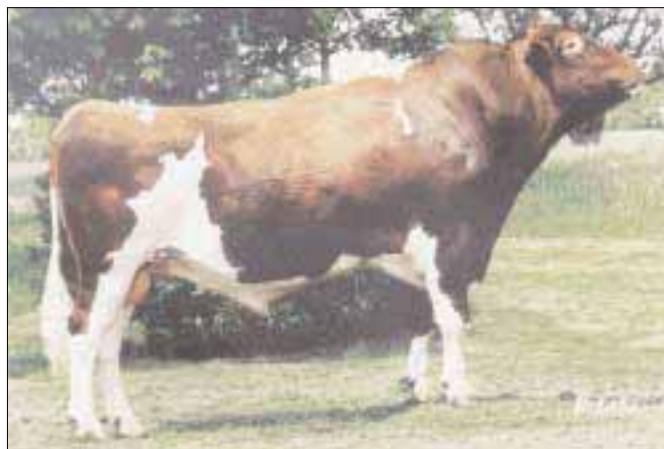
Goldstar boekt winst op productiefrent