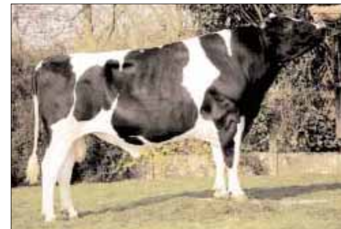
Orphin kreeg exterieurcijfers

Mark terug op de Amerikaanse koefamilie van Satellite Valiant Dora. Helemaal verdwenen is Janze Moun nog niet. In het Interbull-klassement heeft hij nog wel de leiding, maar zijn voorsprong op de nummer twee Jocko Besne is nog slechts 2 euro DPS. De cijfers van Jocko blijven verbazen. De Franse vererfer heeft inmiddels al ruim 10.000 dochters uit Frankrijk, Nederland, Engeland, Duitsland en Italië in zijn fokwaarde, maar stijgt nog steeds. Deze draai vizelde hij zijn DPS op met 30 euro, zijn totaal exterieur nam met twee punten toe. Voor uier won hij zelfs vier punten (+1,0), terwijl hij voor benen van 107 (+1,75) naar 110 (+2,50) klom. Bij zijn jaargenoot Jesther moet de grote stroom fokstierdochters nog