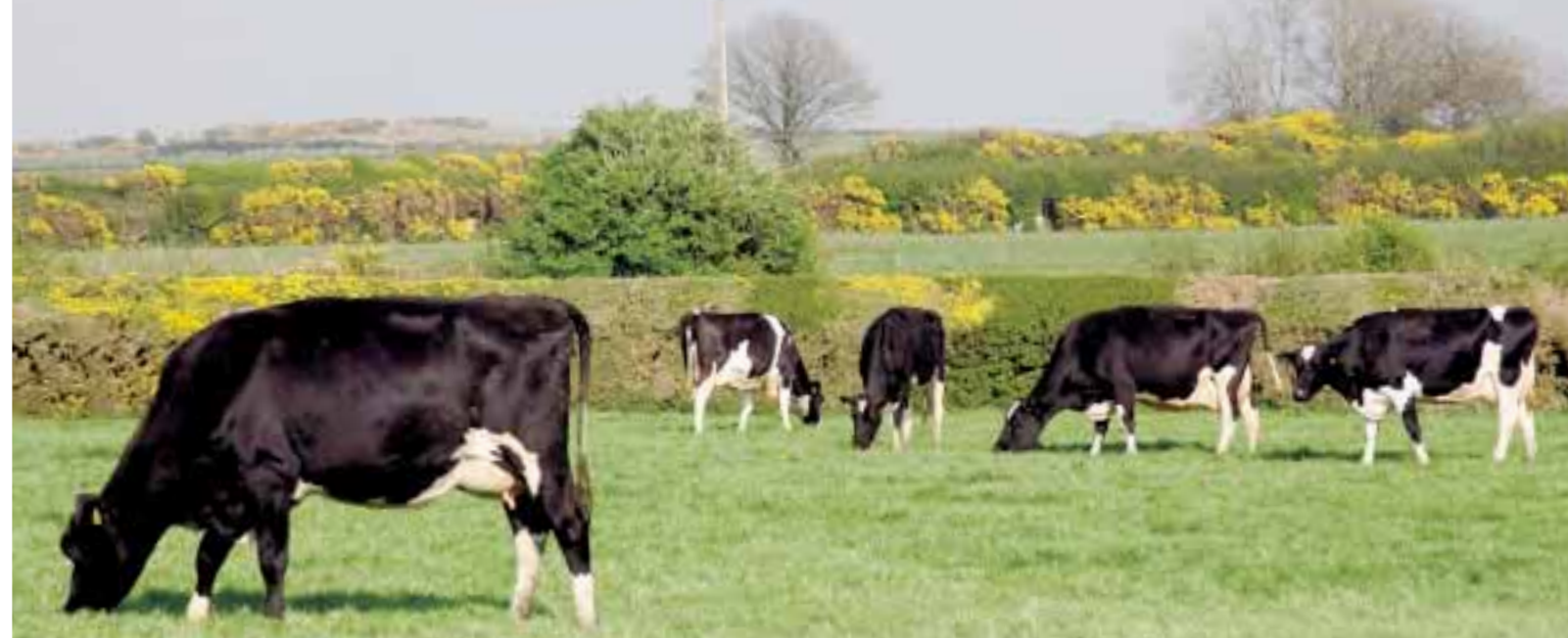
Meer dan 120 excellente Brynhyfrydkoeien grazen in het heuvellandschap van Wales