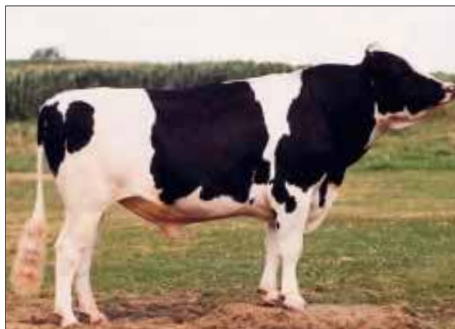
Veel Manfredzonen in Amerikaanse top

de roepnaam O Man luistert, dankt zijn hoge TPI vooral aan zijn hoge productievererving. O Man komt uit de Amerikaanse 92 punten Eltondochter Meier-Medows EL Jezebel. De tweede plek in de TPI- en DPS-lijst is voor Emerald-Acr-Sa T-Dawson. De stamboom van de Demandzoon gaat via achtereenvolgens Mountain, Mascot en Cleitus terug op Rip-valley NA Bell Tammy. De 94 punten Belldochter leverde een aantal fokstieren, waarvan Tonic en Target de meeste bekendheid genieten.