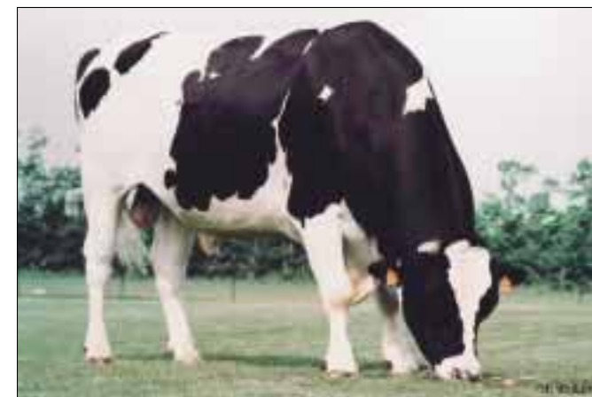
Jocko Besne bestormt opnieuw de Franse top

Buckzoon Jocko Besne doorbreekt de sleur. Korte tijd verdween hij uit de top-10, maar de resultaten van zijn fokstierdochters brengen hem helemaal terug. De jongste draai stijgt Jocko met 105 euro naar 279 euro DPS. De melkvererving van Jocko bereikt met een toename van 577 kg het niveau van 1923 kg melk. Op exterieurgebied is vooral de uitslag voor beenwerk opvallend. Een halfjaar geleden scoorde Jocko nog 101 (0,25) voor benen. Tijdens de februaridraai steeg hij door toevoeging van de Nederlandse en Vlaamse dochters naar 106 (1,50) en de voorlopige eindstand ligt op 107 (1,75). Voor totaal exterieur stijgt Jocko drie punten. Sinds juni 2002 is driekwart van het verkochte Holsteinsperma bij Koole en Liebrechts van Jocko.