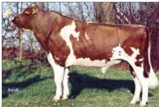
Faber verliest terrein, vooral op productievlak

Zijn populariteit onder roodbontveehouders is hoog. Over de eerste zes maanden van het lopende KI-jaar was de Duitse Faber de meestgebruikte importstier met ruim vijfduizend eerste inseminaties. In de meidraai liep het imago van de Factorzoon een deukje op. Zijn DPS daalde met 38 euro, voornamelijk veroorzaakt door een lagere productievererving. Voor exterieur ging Faber van 112 (3,00) naar 111 (2,75). Zijn score voor benen blijft met 108 (2,00) hoog. Ook de Amerikaanse Marcelzoon Helmsman en de Duitse Origin moesten terrein prijsgeven, respectievelijk met 33