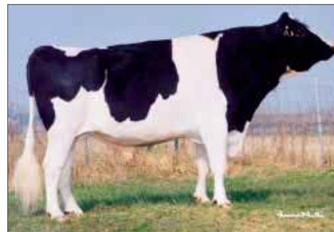
Melkvererfer Raul aast op eerste positie Mtoto