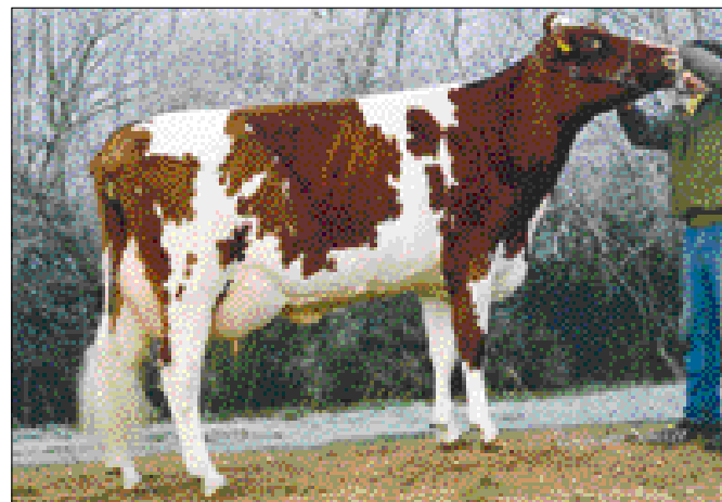
Arabella (v. Milestone) 86 punten Productie eerste lact.: 305 15.295 4,26 3,31