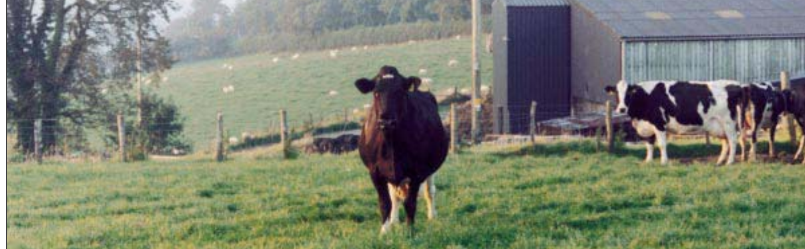
Zwartbonten komen tot rendabele prestaties op grond van gras en citrusmix

de stieren in de afgelopen periode waren Slogan, Osmond, Grand Prix, Hunter en — ook Rodenburg is kennelijk de trend in Nederland niet ontgaan — de roodbonte stieren Jerom, Beautiful en Stadel. 'Die Jeroms, dat zijn beste kalveren. Ik wil robuustere, sterkere koeien.'