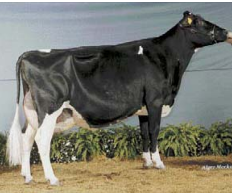
Zwartkop 365 (v. Lucky Leo), kampioene senioren Productie: 4,04 305 12.854 4,77 3,89 LW 170