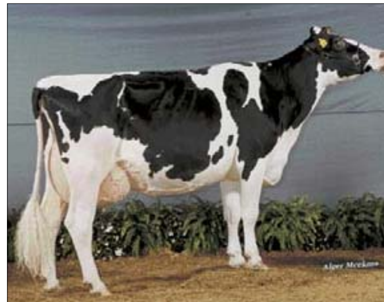
Wag. Retortillo Mina 128 (v. Lucky Leo), kampioene middengroep Productie: 2,08 305 9163 3,99 3,66 LW 110