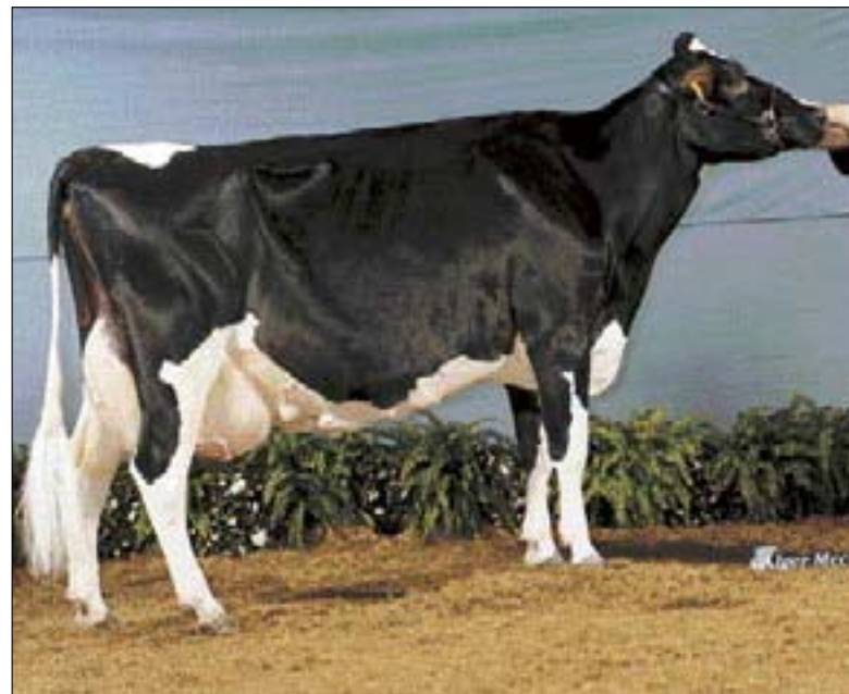
Drouner Ria 508 (v. Ambi), reservekampioene senioren Productie: 5,11 305 12.213 4,95 3,37 LW 118