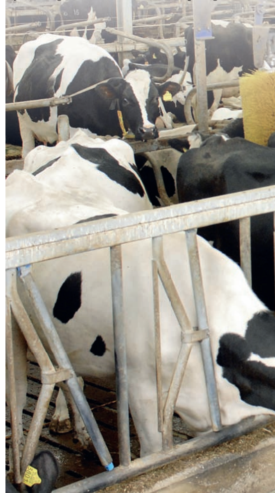
Figuur 1 – Melkproductie eerste- en tweedekalfsdieren nieuwe opfok op de Waiboerhoeve

De vaarzen produceren niet alleen goed, ook hun gezondheid en vruchtbaarheid zijn keurig. Van Werven: 'De voorsprong