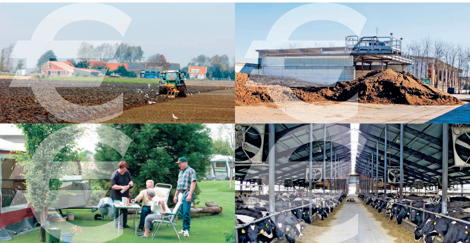
Vier mogelijkheden voor vermindering kwetsbaarheid: samenwerken met akkerbouw, mestscheiding, verbreding en specialisatie

mestdossier. Als dat niet verandert brengt één kuub overschot aan mest de totale mestmarkt uit balans. Het is de vraag in welke vorm we over tien jaar de meeste organische mest aanwenden.’