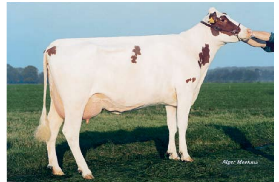
Heihoeve Gusti 42 (v. Spektrum), 85 punten. Productie: 2.00 305 7955 4,94 4,05