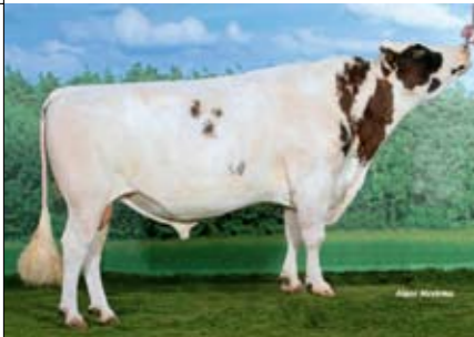
FIDELITY (KIAN X LIGHTNING)