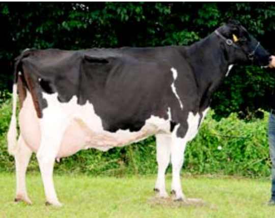
Stouwdamshof Jacoba 15 (v. Rudolph), algemeen kampioene Levensprod.: 2774 109.470 4,13 3,20