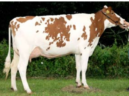
Delta Anny (v. Classic), kampioene jonge koeien Prod.: 2.03 96 2847 3,93 3,44 lw 109 l.l.

Op de fokveedag Noord-Veluwe in Oldebroek was het Stouwdamshof Jacoba 15 die ervandoor ging met de algemene titel. Ook de bekende Massiafamilie viel in de prijzen. De roodbonte vaarzen waren bijna uitsluitend dochters van Classic.