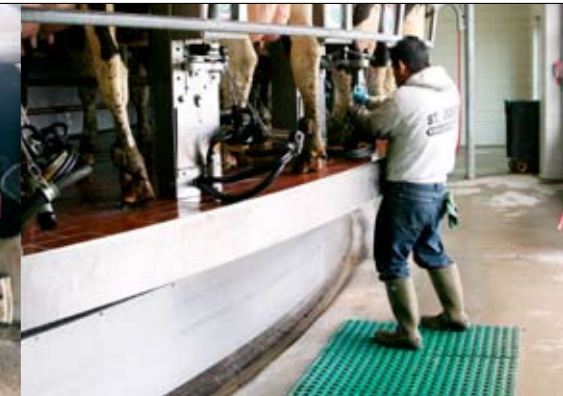
Het werkerterrein van de melker beperkt zich tot de oppervlakte van het groene matje

60 stands-carrouselbuitenmelker. 'De carrousel bepaalt de melksnelheid, niet de melker', noemt Van Loon als grootste voordeel van de stal, waar vijf mensen 400 koeien per uur melken. Op het nieuwe bedrijf worden de koeien die minimaal 15 tot 20 dagen aan de melk zijn, gemolken en gaan ze drie keer per dag door de melkstal. Op dit bedrijf worden de koeien ook geïnsemineerd, te beginnen op dag 50 na kalven. Op het andere bedrijf staan de droge koeien, de verse koeien tussen 0 en 15-20 dagen na kalven, de hospitaalkoeien en eventueel de probleemkoeien (met mycoplasma of para-tbc). Deze vragen meer aandacht en verzorging. De droge koeien gaan binnenkort naar een apart bedrijf, dat volop in constructie is. Alles is anders in de Verenigde Staten, weet Van Loon. 'Inclusief de economie. In Europa probeer je het quotum zo goedkoop mogelijk vol te melken. Hier telt de economie van elke stalplaats.