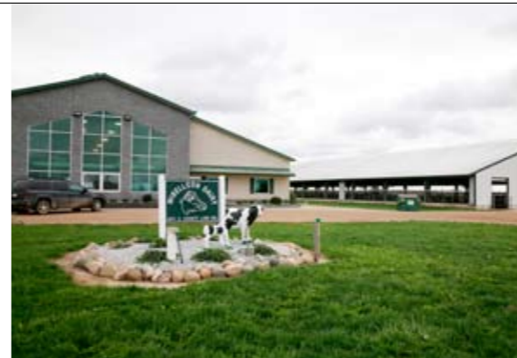
Mibelloon Dairy in Michigan is een 24 uursbedrijf

Om verder op te schalen bouwde de familie een tweede bedrijf erbij met een