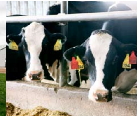
Koeien met rode oornummers zijn dragers van para-tbc en staan in een aparte groep