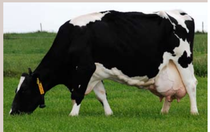
Rud Fortuna: duizendste tientonner