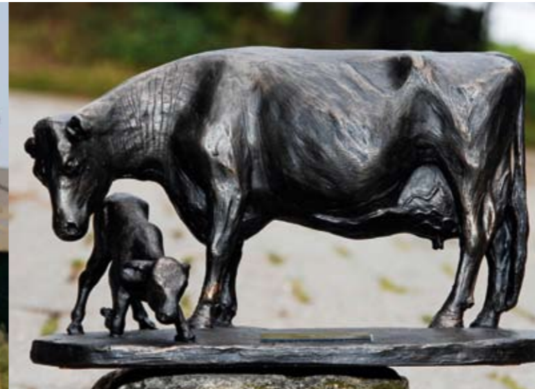
Beeld 'Koe met kalf' voor eigenaren tientonniers

Tientonner Bonus Verona 2 (v. Blackstar) met ruim 170.000 kg melk