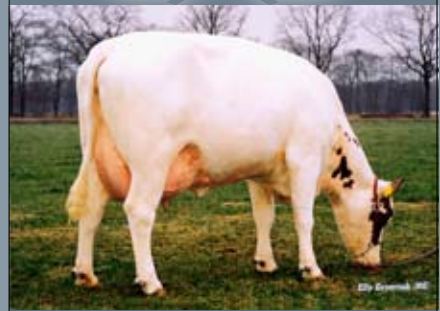
Superstiermoeder Jolanda 94 (v. Ajax 115)