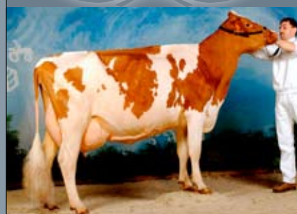
Belgisch nationaal kampioene 2004 Suzan (v. Stadel)