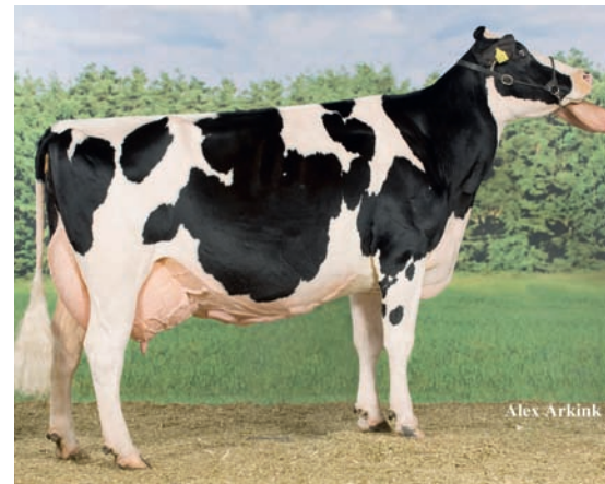
Bons-Holsteins Dikkie 126 (v. Fandango), reservetitel oudere koeien Levensproductie: 2331 80.491 4,64 3,85