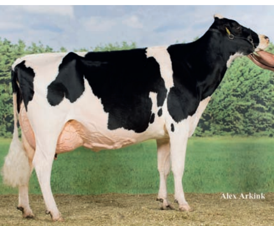
Bons-Holsteins Koba 167 (v. Stormatic), kampioene middenklasse Productie: 3.03 489 17.381 4,11 3,61

Ruim vier jaar hadden ze moeten wachten op een nieuwe CRV Koe-Expo mét individuele keuring. De fokkers uit het zuiden van Nederland konden in Den Bosch – eindelijk weer – hun individuele koeien laten zien, voor een publiek van 4000 toeschouwers. Het gebied waaruit de koeien afkomstig waren, was zelfs iets uitgebreid. Ook koeien uit de Achterhoek en een klein stukje van Overijssel waren ditmaal welkom.