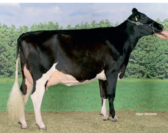
Jonker Martha 579 (v. Goldwyn), reservekampioene vaarzen Productie: 2.02 160 5198 3,58 3,03