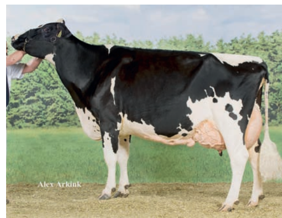
Wilhelmina 358 (v. Juror), kampioene oudere koeien Levensproductie: 1988 80.746 3,64 3,11