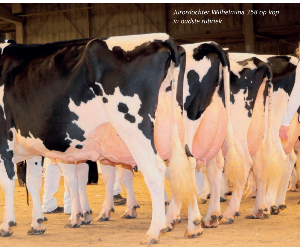
Jurordochter Wilhelmina 358 op kop in oudste rubriek