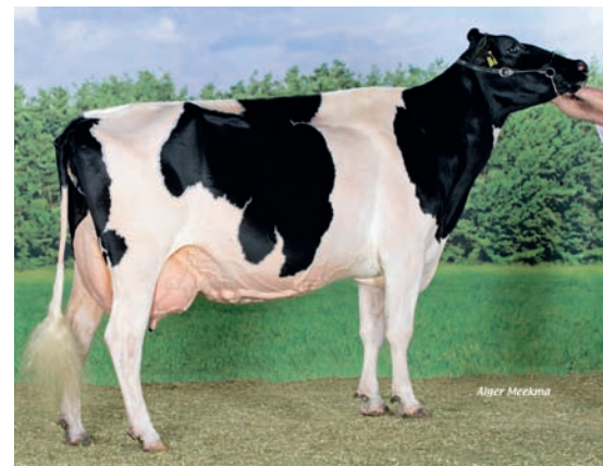
Bons-Holsteins Ella 145 (v. Lyster), reservetitel middenklasse Productie: 2.07 570 18.376 3,89 3,58

👉 Kijk voor de videoreportage op veeteelt.nl