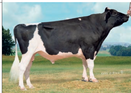
RALMA O-MAN CRICKET (O MAN X DURHAM)

Betr. nvi 73% (cijfers op zwartbontbasis)