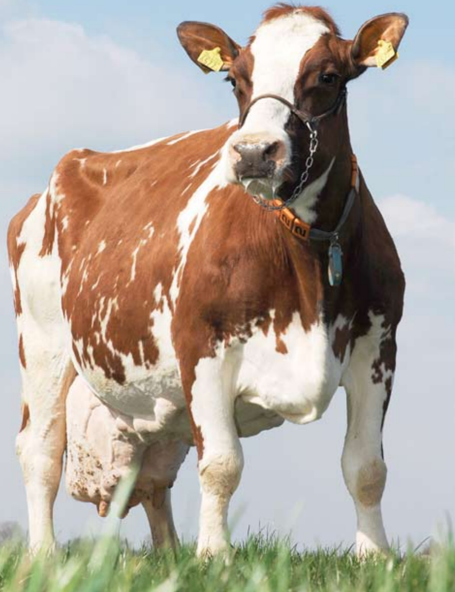
De Vinkenhof Roza 23 (v. Manuel 142)

Roza 23 is inmiddels weer drachtig, produceert langzaam verder en lijkt zeker nog niet aan het einde van haar carrière op De Vinkenhof. |