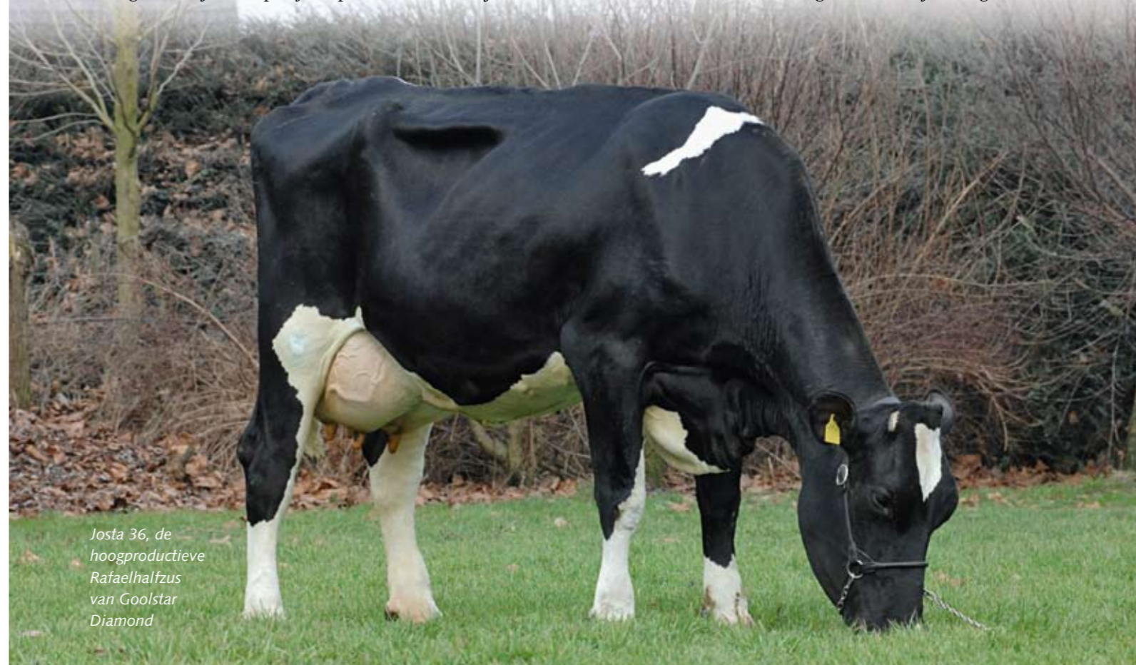
Josta 36, de hoogproductieve Rafaelhalfzus van Goolstar Diamond

In Dorst zet Josta 36, een Rafaeldochter van hoge producties voort. Ze maakte in 305 dagen een vaarzenlijst van 9618 kg melk met 4,43% vet en 3,60% eiwit en een lactatiewaarde van 125. 'In exterieur kunnen de nakomelingen van Josta 29 haar nog niet evenaren. De familie staat op dit moment daarom ook niet in de foktechnische belangstelling', vertelt Van Gool. 'Maar we krijgen uit een spoeling nog een vol zusje van Diamond aan de melk en een week geleden heeft een Toystorydochter uit de Trenthalfzus van de stier gekalfd. Dat lijkt ook goed.'