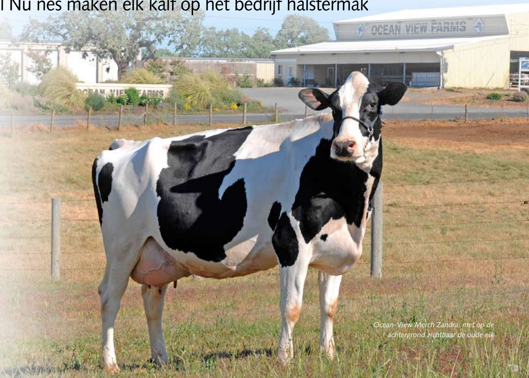
Ocean-View Merch Zandra, met op de achtergrond zichtbaar de oude eik