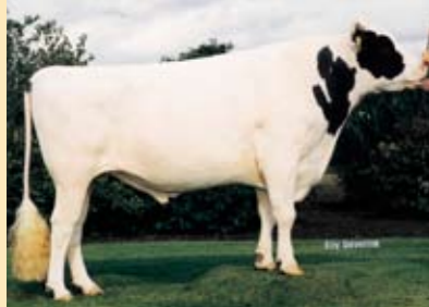
Lightning (zie foto) levert Twister

Stierindex 82 % betr. (cijfers op roodbontbasis) kg m. % v. % e. kg v. kg e. inet nvi du +741 -0,52 -0,06 -9 +21 +37 +183 108