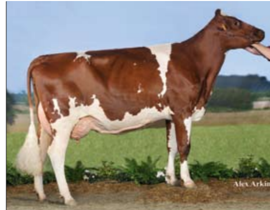
Kiana (v. Canvas), kampioene vaarzen Productie: 2.01 316 9534 3,99 3,70 lw 123 l.l.