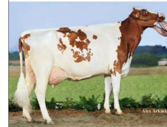
Amazone (v. Stadel), reservekampioene senioren Productie: 3.01 10.984 4,08 3,49 lw 115