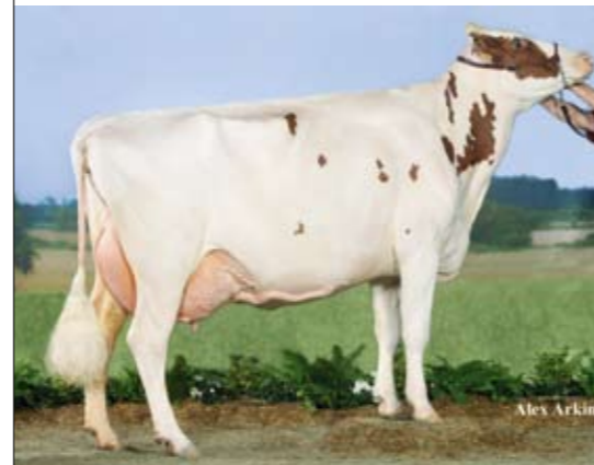
Alannah (v. September Storm), algemeen kampioene Productie: 2.03 305 8477 3,66 3,19 lw 102