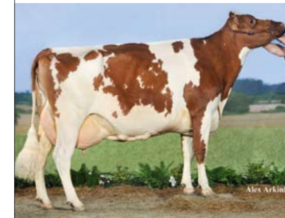
Vrouwke (v. Stadel), kampioene senioren Productie: 3.08 320 10.162 4,04 3,41 lw 110