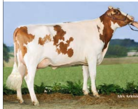
Bernadette (v. Pickel), reservekampioene vaarzen Productie: nog niet bekend