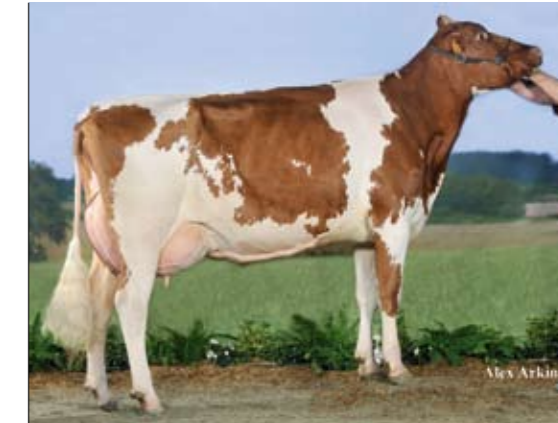
6167 (v. Talent), reservekampioene midden Productie: 2.00 296 6691 4,09 3,59 lw 104