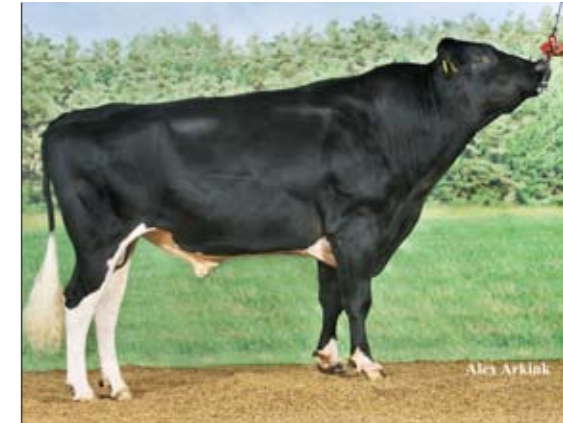
Barclay ontloopt zich als sterke allrounder

De talentvolle debutanten van de vorige draai – Roppa en Butembo – houden zich redelijk goed. Butembo stijgt een punt in uier en benen, terwijl zijn volle broer Roppa zich nog nadrukkelijker als uierspecialist manifesteert (114). Wel boet Roppa in op levensduur. Delta Barclay (v. Lord Bailey) komt steeds meer bovendien. De aprildebutant van 2008 (de hoogste na Bertil) kwam in september op de stierenkaart en stijgt voor de tweede opeenvolgende draai (+17). Andere stijgers zijn Win 395 (+21), Kirby (+31), Obelisk (+21), Jorryn (+24), Wilson (+25) en Canvas (+18). Canvas is met +2695 kg melk de op één na hoogste melkstier met een Nederlandse fokwaarde. De hoogste benenstier (114) van Nederland luistert naar de naam Pole Position. Daarmee scoort de Stormaticzoon van KI Kampen een punt hoger dan Duplex, die opklimt tot hoogste exterieurstier (118 totaal). De belangrijkste verliezers deze draai zijn Onedin (-24), Rocko (-23) en Linfield (-34). Een daling van honderd dagen levensduur verklaart het verloren terrein (-27) van Lucky Mike. De fokstierdochters van Alexander en Fortune bezorgen hun vader een lichte nvi-daling, maar een verbetering van het exterieurplaatje. Alexander stijgt vier punten voor frame. Fortune wint punten voor frame (+2), robuustheid (+2) en uier (+1), al verliest hij er voor benen (-3). CRV verwacht een dochtergroep van hem te presenteren tijdens de CRV Koe-Expo in Zwolle.