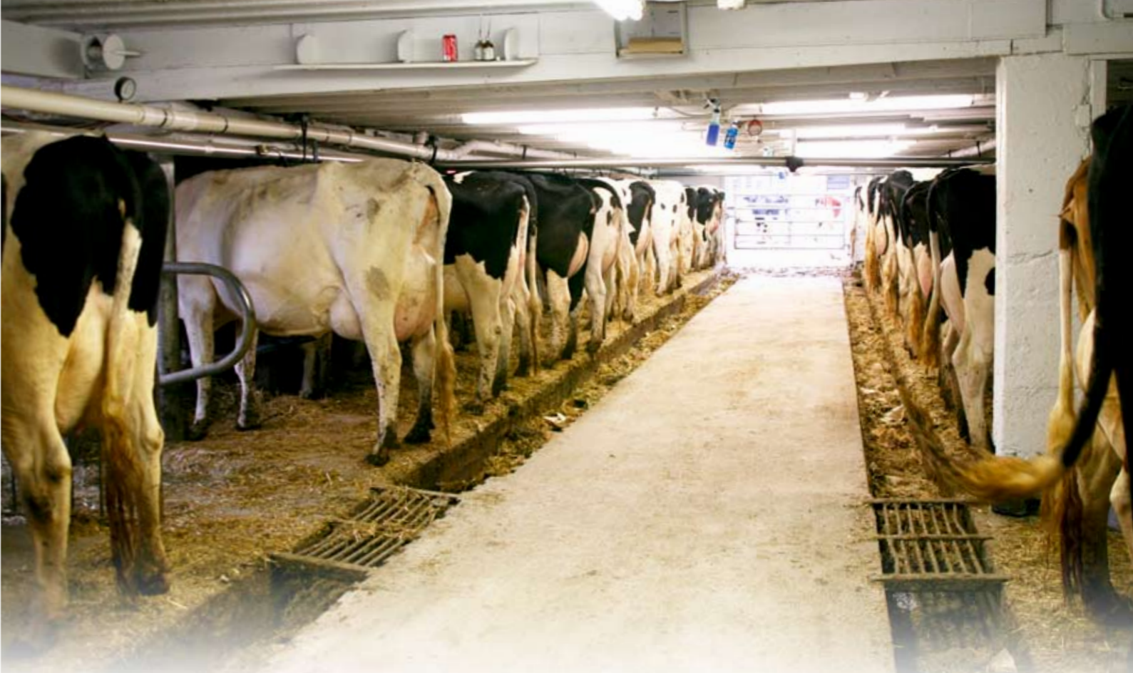
De 160 melkkoeien worden gemolken op de 2 x 19-grupstal

maar alleen nadat we er zelf eerst embryo's uit gehaald hebben. Zo fokken we een nog betere volgende generatie en houden we een voorsprong.' Luck-E verkoopt jaarlijks 80 tot 100 stieren – 'we verlesen ze het liefst, 5000 dollar vinden we te weinig' – en ook nog eens 100 vrouwelijke dieren, vaak in de tweede lactatie en al drachtig gescand, waarbij het geslacht van het kalf ook al bekend is. 'Dat kan onze dierenarts al zien op dag 50.' Het hoogste bedrag dat vader en zoons