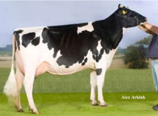
Bons-Holsteins Ella 153 (v. Allen), kampioene vaarzen Prod.: 2.08 238 8749 4,29 3,62 126 lw l.l.

Niet Aaltje 69 – de favoriet van menigeen – maar Bons-Holsteins Ella 153 ging er met de winst vandoor. De rastypische Allentelg heeft dezelfde grootmoeder als Ella 145 (v. Lyster), die vorig jaar het kampioenschap opeiste. Ella 153 beschikte over een fraaie schouderpartij en een superhoge achteruier. Ze liep op droge benen