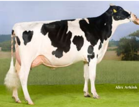
Bons-Holsteins Aaltje 69 (v. Gibson), reservekampioene vaarzen Prod.: 2.04 34 1017 5,00 3,02 110 lw l.l.