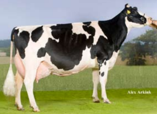
Bons-Holsteins Dikkie 126 (v. Fandango), kampioene senioren Prod.: 5.09 383 16.023 4,43 3,73 130 lw