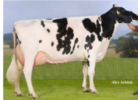
Bons-Holsteins Ella 139 (v. Boss Iron), reservekampioene middenklasse Prod.: 4.07 353 13.943 4,91 3,70 123 lw