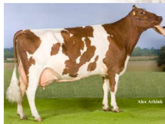
Brook Mina 28 (v. Taco ), reservekampioene senioren Prod.: 6.06 231 9418 4,16 3,21 lw 119 l.l.