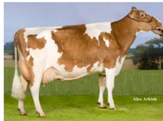
Zeedieker Mon-Chri 1 (v. Jordan ), reservekampioene midden Prod.: 2.02 12.143 4,24 3,20 lw 119