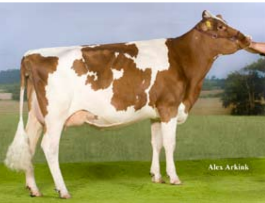
Massia 61 (v. September Storm ), reservekampioene jong Prod.: 2.05 23 680 3,56 2,41 lw 98 l.l.