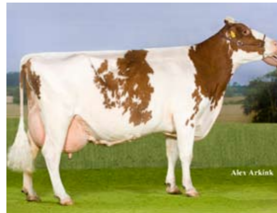
Doortje 2370 (v. BevNick ), kampioene senioren Prod.: 6.04 343 11.051 4,41 4,01 lw 110