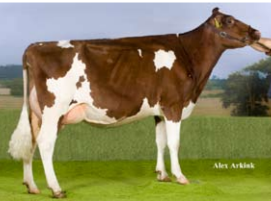
Rittie 376 (v. Dante ), kampioene jong Prod.: 2.07 31 779 3,31 3,13 96 l.l.

den op zijn optreden. 'Ik begrijp dat er wat te discussiëren valt. Maar melktype en inhoud in het skelet vind ik belangrijk omdat koeien veel ruwvoer moeten verwerken. De marges in de melkvee-sector zijn klein, waardoor koeien op jonge leeftijd al aangezet worden tot hoge melkproducties. Daarom zijn kwaliteitsuiers belangrijk en let ik vooral op de hoogte en breedte van de achteruier en de lengte van de vooruier. Natuurlijk jureer ik ook op beenwerk, maar ik let vooral op melktype en uiers.'