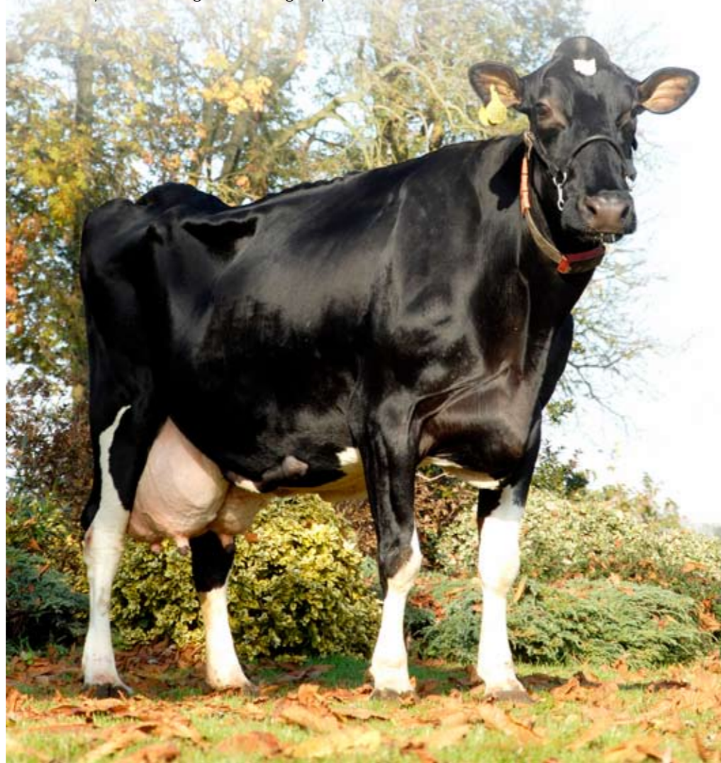
Momi 15: bijna 140.000 kg melk en nog altijd alert

nooit lang vol. 319 geeft meestal vier dagen na het kalven al weer 50 kg melk en dat houdt ze heel lang vol.'