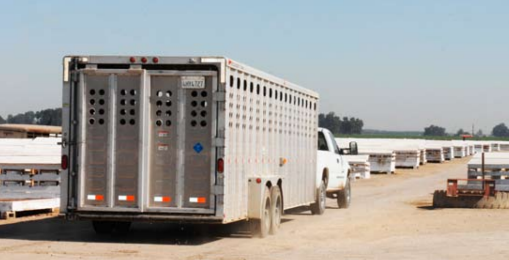
De nuchtere kalveren worden dagelijks aangevoerd

op een nacht opvangt, kun je je voorstellen dat ze wel eens een kalf overslaan. Doordat ik de bloedwaarden doorspreek met de bedrijfsleider kan hij als dat nodig is maatregelen treffen. Door te meten heb je een extra controlemogelijkheid.' Kalveren die onvoldoende biest hebben gehad, herkent Teunissen snel. 'Die zijn veel vatbaarder voor diarree en hebben een veel tragere groeistart.' De eerste veertien dagen krijgen de kalveren tweemaal per dag drie liter kunstmelk. Daarna zijn ze sterk genoeg voor een overgang naar een melkmengsel