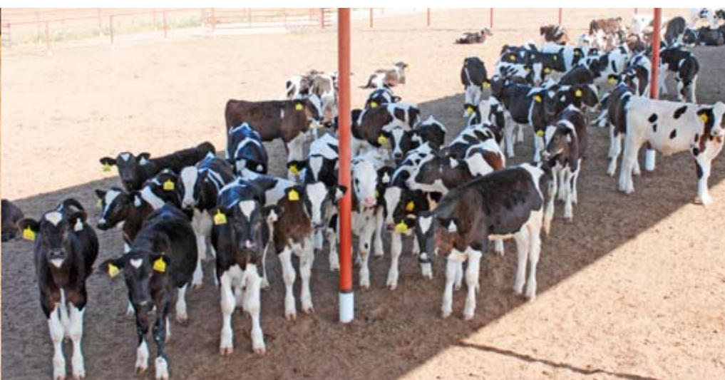
In groepshokken kunnen de kalveren schuilen tegen de zon

van gesekst sperma. 'Pinken drachtig van gesekst sperma leveren 200 dollar per stuk meer op. Stierkalveren zijn hier niets waard, terwijl vaarskalveren erg gewild zijn omdat de bedrijven willen groeien.' Die bedrijfsontwikkeling zorgt volgens Bruins ook voor een grote vraag naar gespecialiseerde kalveropfokbedrijven. 'Ik ben zelf gestopt met de opfok van kalveren voor anderen omdat door de hoge voerprijzen de marge minimaal werd. Kalveropfok moet je net zo zake-lijk benaderen als het houden van melkvee. Het gaat erom dat je aan het eind van de rit geld overhoudt.'