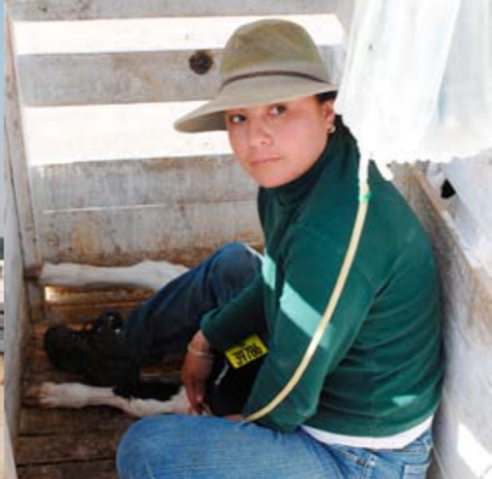
Ingeven van een infuus tegen uitdroging

neemt in die periode 25 kilogram melkpoeder op. 'Ik geloof niet in verkorten van de melkperiode. Bezuinigen op kalvervoeding zie je op latere leeftijd terug. Dat kalveren eerder ruwvoer opnemen als ze minder melk krijgen, geloof ik niet. Wij voeren vanaf de eerste dag ook al een mix van granen en vanaf twintig dagen merk je pas dat ze daar echt wat van gaan opnemen.'