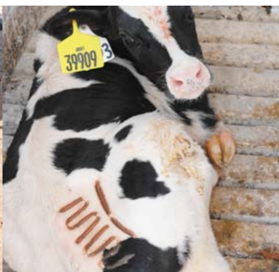
Brandmerken moet diefstal voorkomen