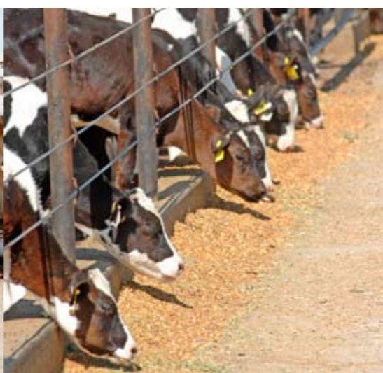
De kalveren krijgen een mix van granen

met kalk en gooien we er een nieuwe strooisellaag in.' De navels van de pasgeboren kalveren worden standaard gedipt met een jodiumoplossing en alle kalveren krijgen na de geboorte volgens protocol binnen vier uur twee liter biest. Elke morgen worden de kalveren opgehaald, over het jaar gezien zijn dat er gemiddeld 25 per dag. 'We weten dat hygiëne in de afkalfstal belangrijk is, zeker wanneer er in toptijden 50 koeien per dag afkalven', aldus Booiijk. 'Uitbesteden van de kalveropfok kost geld, maar omdat een goede opfok zo belangrijk is, vinden we het echt werk voor specialisten.'