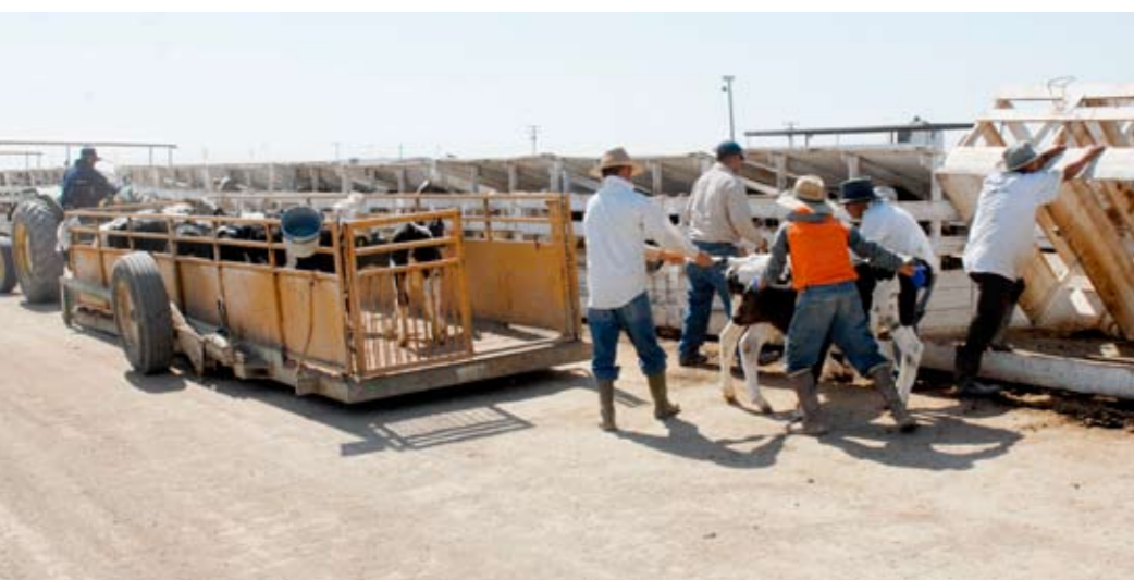
Na twee maanden gaan de kalveren naar groepshokken