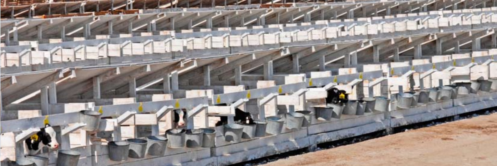
De kalverboxen zijn van hout en kosten 70 dollar voor drie plaatsen