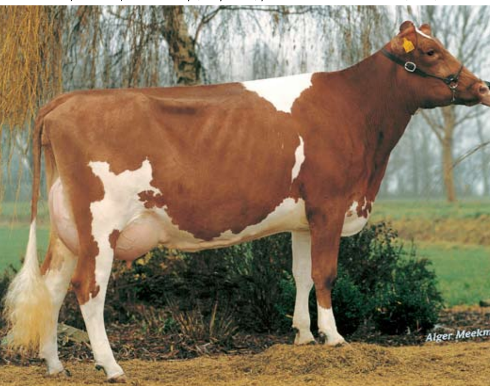
Huybens Pietje 514 (v. Tulip), 87 punten, productie: 2.02 305 9705 4,65 3,66 lw 139