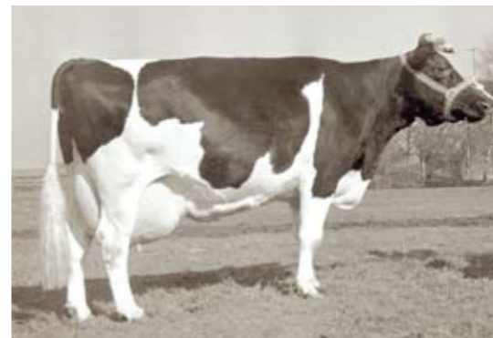
Pietje 131 (v. Adema 312 van de Woudhoeve), 89 punten Productie: 7.11 9169 4,37 3,32