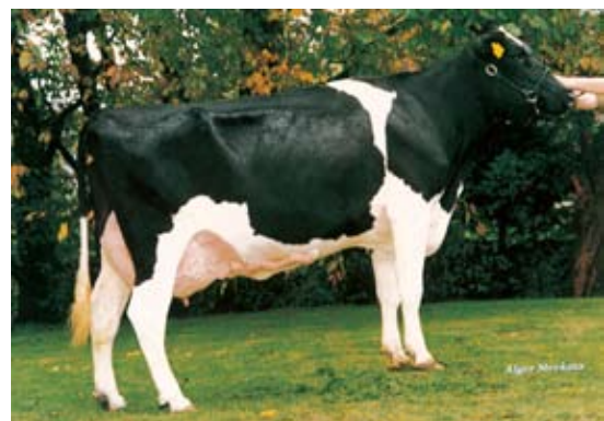
Pietje 478 (v. Amos), 86 punten, moeder van Russel Productie: 3.02 305 10.023 5,02 4,12

Ondanks dat op dit moment alle ogen gericht zijn op de roodbontlijn staan ook de zwartbonte Pietjes nog altijd in de be-