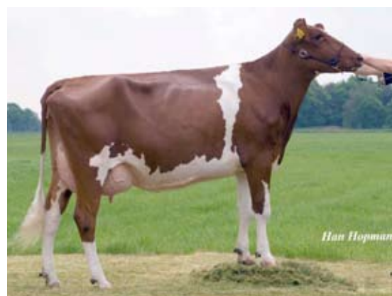
Apina Pietje 515, 86 punten, volle zus van Tequila Productie: 2.01 9.055 4,15 3,58 lw 110