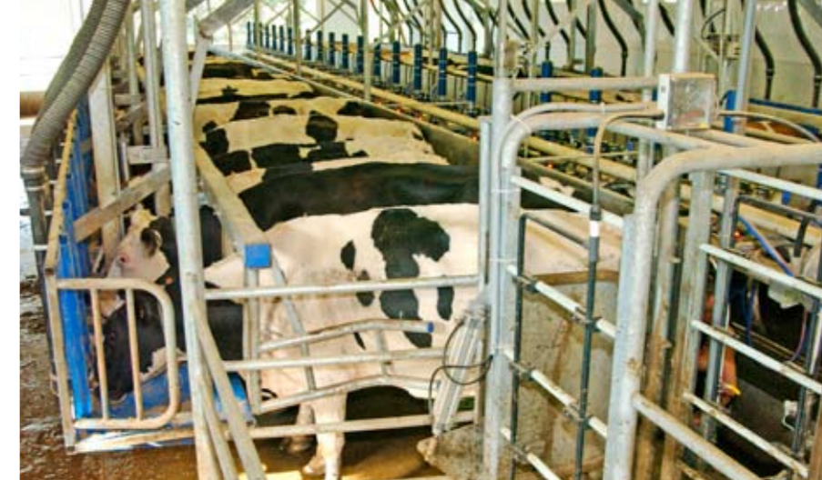
In de 2 x 24 swingover-rapid-exit-Dairymaster worden tweehonderd koeien per uur gemolken

Nijhof kocht wat spermarietjes en haalde enkele holstein x fleckviehembryo's naar Canada. 'De vruchtbaarheid werd direct een stuk beter', vertelt Albert. 'Na het afkalven werden de koeien al snel