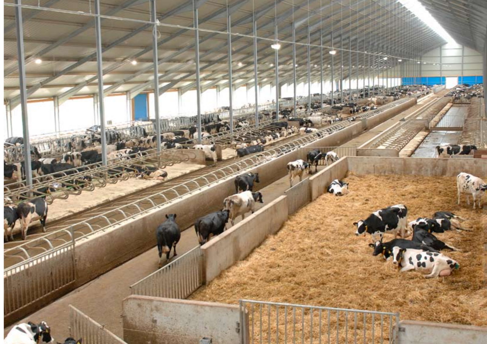
De imposante stal is 340 meter lang en 55 meter breed

De forse omvang van het bedrijf lijkt de arbeidsefficiëntie niet ten goede te ko-