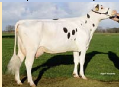
Delta Magnolia, O Manzus van Roppa en Butembo

Betr. nvi 75 % (cijfers op zwartbontbasis)