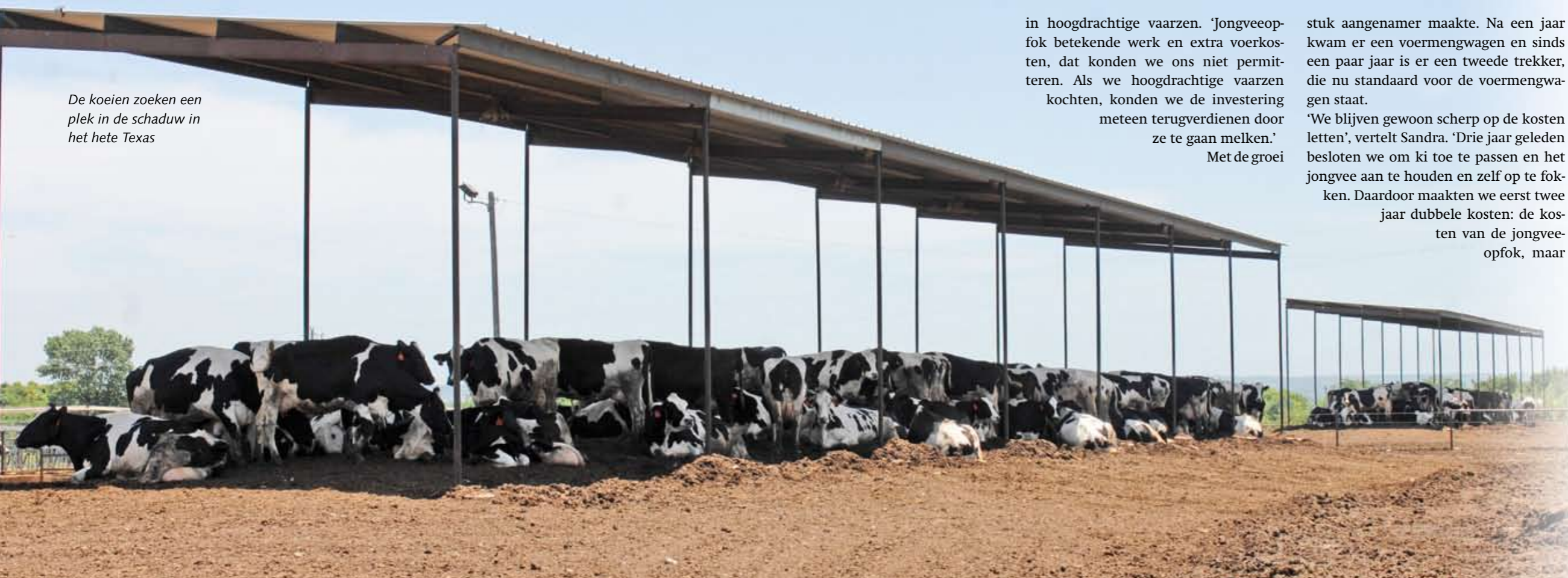
De koeien zoeken een plek in de schaduw in het hete Texas

stuk aangenamer maakte. Na een jaar kwam er een voermengwagen en sinds een paar jaar is er een tweede trekker, die nu standaard voor de voermengwagen staat. 'We blijven gewoon scherp op de kosten letten', vertelt Sandra. 'Drie jaar geleden besloten we om ki toe te passen en het jongvee aan te houden en zelf op te fokken. Daardoor maakten we eerst twee jaar dubbele kosten: de kosten van de jongveeopfok, maar