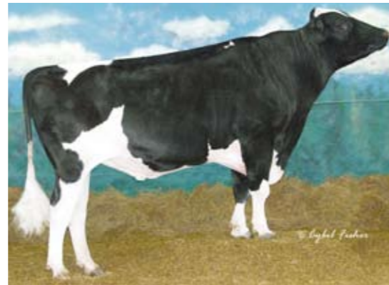
Penn-England Garrison, sinds kort miljonair