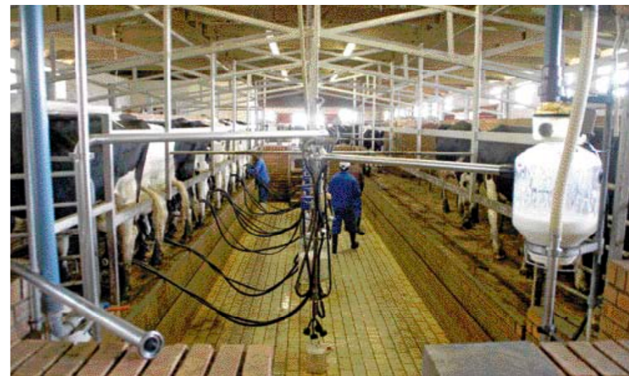
In de tienstands swingovermelkstal werken steeds drie man

Crookes' koeien hoeven van hem niet hoog te pieken, maar ze moeten de productie wel volhouden. En het oog wil ook wat. 'Ik houd wel van een koe die een beetje scherp in de voorhand is. En ze mag wat hoogte hebben', zegt hij. Alle koeien van Copperleigh Holsteins worden gekeurd door het Zuid-Afrikaanse