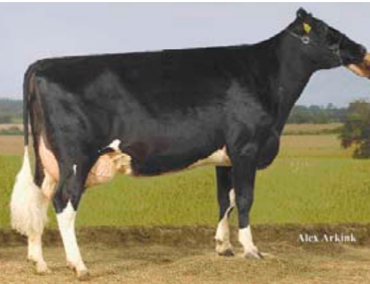
Wilhelmina 401 (v. James), reservekampioene vaarzen Prod.: 2.04 266 8800 3,93 3,41 114 lw l.l.