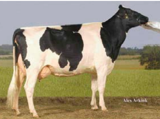
Bons Holsteins Ella 145 (v. Lyster), kampioene vaarzen Prod.: 2.07 152 5463 3,95 3,58 130 lw l.l.