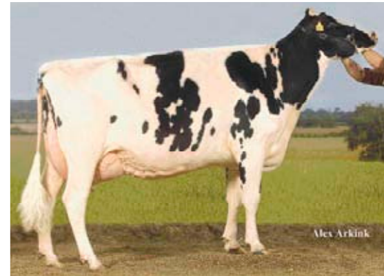
Bons Holsteins Ella 139 (v. Boss Iron), reservekampioene middenklasse Prod.: 3.08 293 7806 5,03 3,76 90 lw