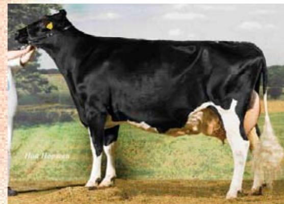
Wilhelmina 369 (v. Allen), reservekampioene senioren Prod.: 4.04 345 15.452 3,40 3,38 114 lw