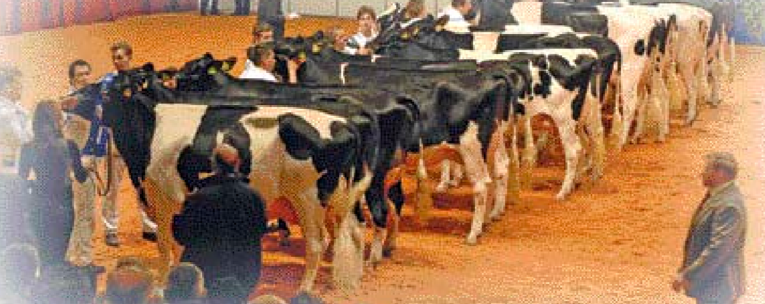
De juniorenklasse met Ella 145 en Wilhelmina 401 aan kop

145. Critici vonden Ella in bovenbouw wat gespannen, maar ze showde klasse framekenmerken, harde benen en een sterk opgehangen uier.