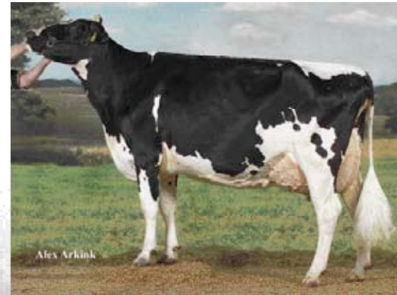
Wilhelmina 358 (v. Juror), kampioene senioren Prod.: 4.07 558 23.662 3,66 3,16 114 lw