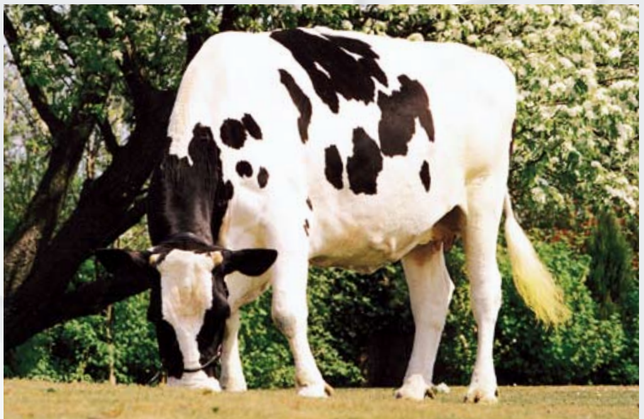
Pietje 175, de moeder van Sunny Boy op vijftienjarige leeftijd

Ook Celsiusdochter en moeder van Jorryn Skalsumer Pietje 513 bewees de duurzaamheid van de Pietjes doordat ze afgelopen herfst de 10.000 kg vet en eiwit overschreed. Haar Addison dochter Skalsumer Pietje 598 behoort inmiddels tot het gezelschap van honderdtonners. De daaropvolgende twee generaties zetten de familietraditie voort en staan voor nationale en buitenlandse ki-organisaties onder contract, met de hoop op een tweede Sunny Boy.