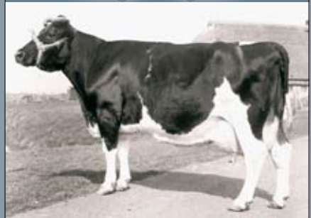
Preferente stammoeder Pietje 80 (v. Anna's Adema)